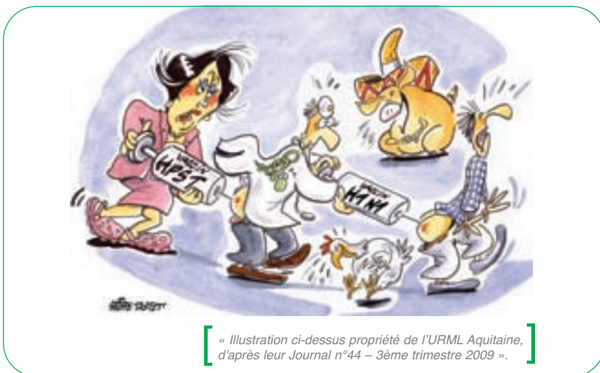
« Illustration ci-dessus propriété de l'URML Aquitaine, d'après leur Journal n°44 – 3ème trimestre 2009 ».

Il faut travailler encore pour construire cette URPS, Le SML vous attend, rejoignez-le !