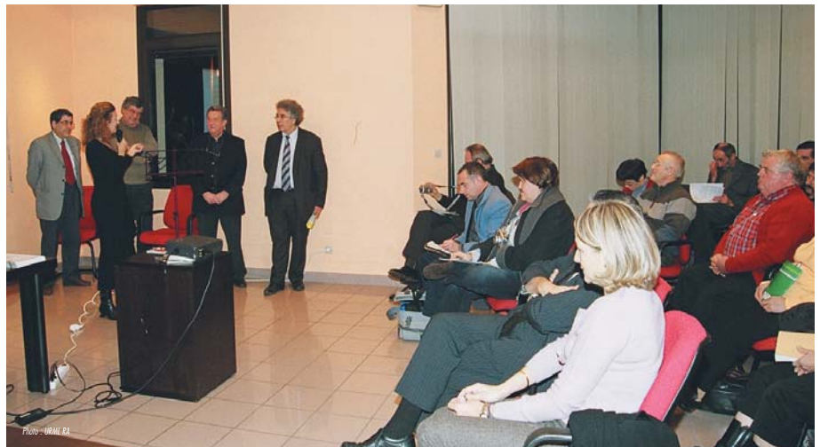
Ouverture du réseau MADO à Annonay

L'aspect cognitif de la dépendance est analysé mais également les difficultés motrices, mises en évidence par un ergothérapeute.