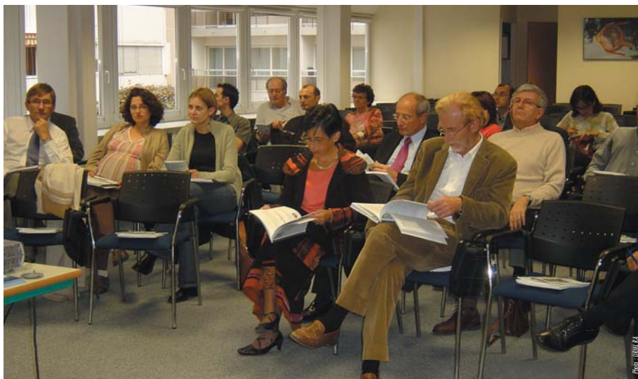
Les internes et les médecins généralistes réunis le 16 novembre 2005

Une seconde table ronde axée sur les attentes et les représentations de