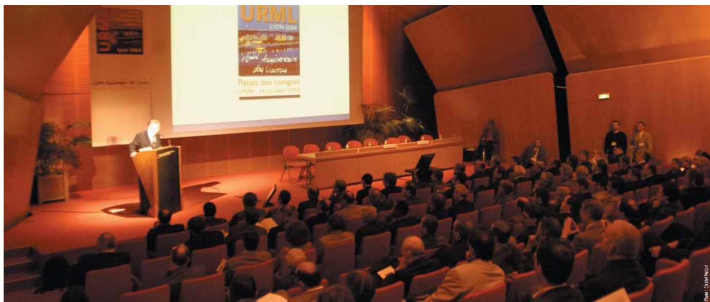
Congrès des 10 ans des Unions au Palais des Congrès de Lyon le 16 octobre 2005

anticiper les mutations majeures de notre profession. vements d'attitude de la population sont autant d'éléments dont nous auprès des pouvoirs publics. Notre objectif à travers cette action qualité de prise en charge du patient.