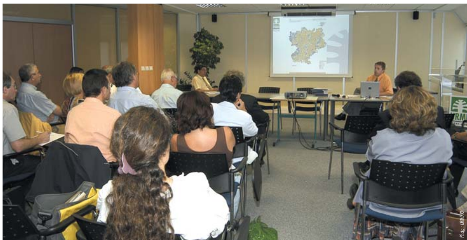
Présentation de l'étude Géosante, dans les locaux de l'URML RA

Le critère actuel qui supprime toute aide aux secteurs comptant moins de 1500 habitants par médecin est purement économique mais l'humain est négligé. Moins les communes sont habitées, plus leurs habitants sont vieux, plus ils nécessitent ces soins de proximité désormais condamnés ! Or la République demande, théoriquement, que nous soyons égaux en matière de santé. »